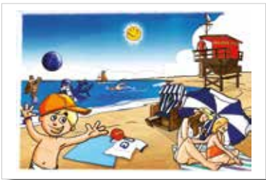
Strandsituation zum Einstieg in die Situation

Schaut euch mit den Kindern an, welchen Notfall Nobby am Strand beobachtet. Ein Kind wird am Strand von einer Biene gestochen und reagiert allergisch. Zum Glück weiß Nobby, was er als Ersthelfer tun kann.