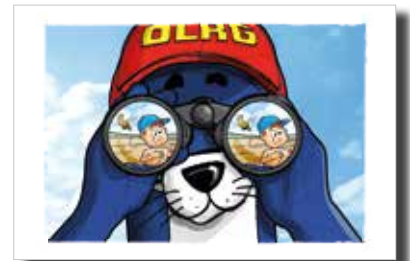
Was ist passiert? Aufmerksam sein