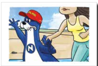
Hingehen und Hilfe anbieten